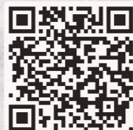
暖身系列活動報名